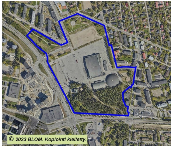
Asemakaavamuutoksen suunnittelualue ilmakuvasa.